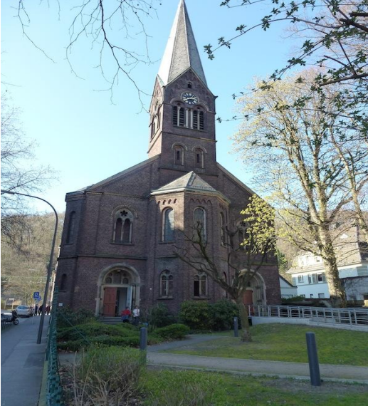
Die Pauluskirche in Wuppertal-Unterbarmen

Benefizkonzert mit dem Blasorchester des Orchestervereins Bayer Wuppertal in der Pauluskirche, Pauluskirchstr. 8 in Wuppertal-Unterbarmen am Sonntag, 14. Mai 2023 um 17:00 Uhr zum Erhalt der Pauluskirche