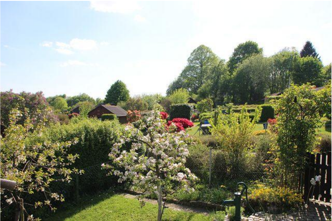
Blick in unsere idyllisch gelegene Gartenanlage